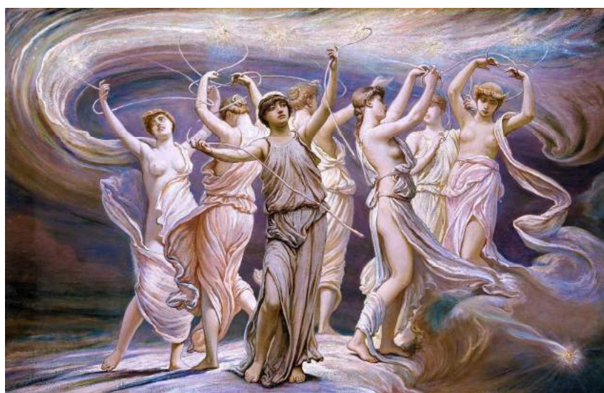
Le Pleiadi , Elihu Vedder, 1885

Nonostante questi due tipi di spiegazioni possano far apparire il mito come qualcosa di molto distante dall'esperienza dell'uomo moderno, in realtà, le narrazioni mitiche, hanno col tempo assunto una tale complessità da possedere svariati livelli possibili di lettura, assumendo così un valore slegato dalle vicende storiche, riposto in ciò che dell'esperienza umana universale questi testi possono dire e insegnare. Attraverso i miti, si sono codificati e trasmessi conoscenze sul mondo e sull'uomo, credenze, principi morali, norme di comportamento: insomma, tutto ciò che era ritenuto importante per l'organizzazione, la sopravvivenza e la continuità della comunità.