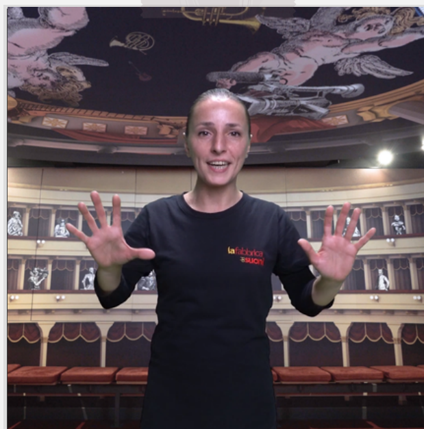
Lilith, la Narratrice