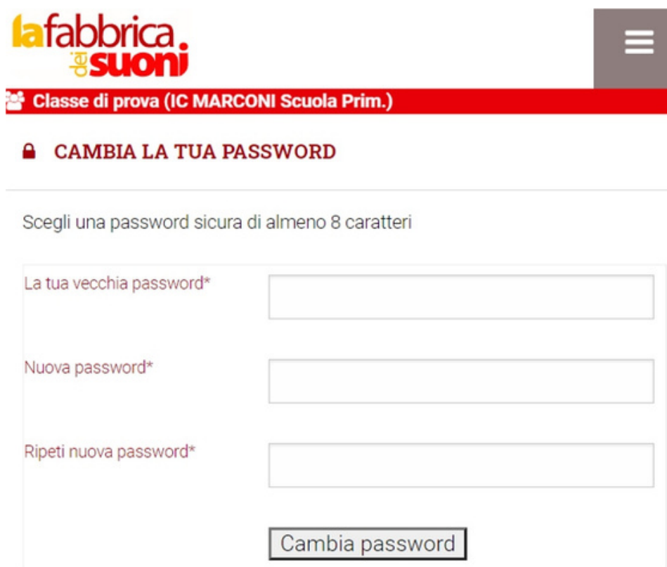
Figura > Videata D

Per fare questo cliccare sullo username che compare in alto a destra (evidenziato in giallo nella videata C), e seguire le istruzioni, come nella videata D: