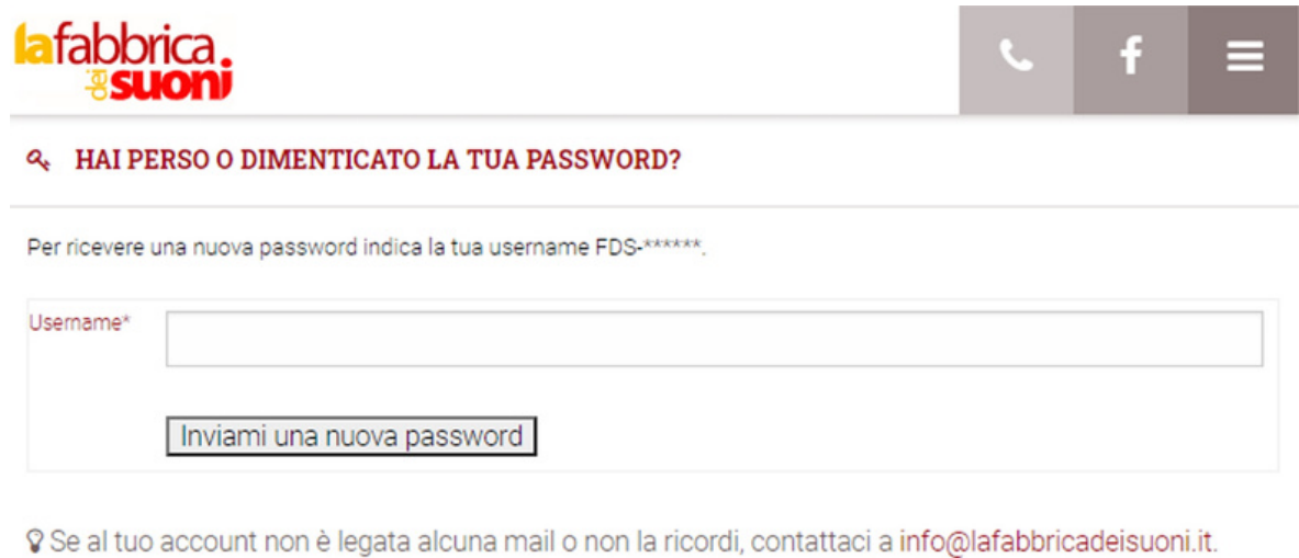
Figura > Videata B

Per effettuare questa richiesta bisogna essere in possesso del proprio username.